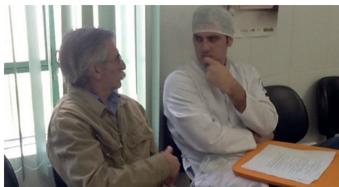
Figura 1 - Entrevista com os pacientes da ESF Augusta Meneguine, Viamão, 2013.

Os dados foram coletados em dias de sábado, entre agosto e outubro de 2013, durante os mutirões de saúde interdisciplinares realizados na referida UBS, acompanhando as atividades de extensão universitária (nº 22513) denominada Ações Interdisciplinares em Educação para Saúde da Universidade Federal do Rio Grande do Sul (UFRGS). (Figura 1).